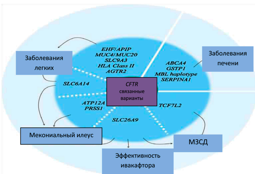
Рис. 1. Гены-модификаторы муковисцидоза [32]

Гетерогенность фенотипических проявлений заболевания у людей с одинаковым генотипом CFTR позволяет предполагать, что существуют другие факторы, влияющие на тяжесть заболевания, такие, например, как гены-модификаторы, которые могут модулировать фенотипическую картину заболевания (рис. 1) [30, 31].